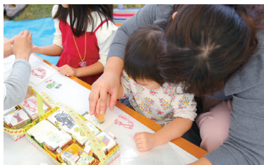
古代のグッドデザイン (10/20(日)のみ)