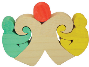
組み木で古代文様