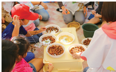
木の実で遊ば! (10/19(土)のみ)