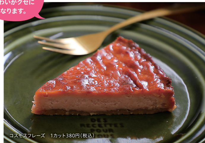
コスモスフレーズ 1カット380円(税込)