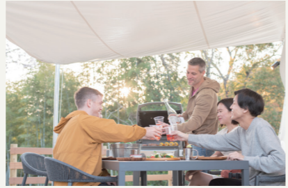
2020年4月にオープンした緑豊かな宿泊施設。