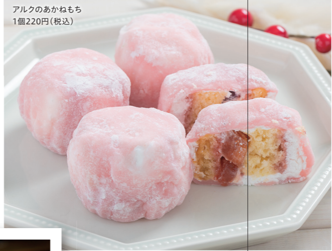
アルクのあかねもち 1個220円(税込)

店内にはケーキをはじめとした生菓子の他にも、お土産にオススメな焼きドーナツ等の焼き菓子も充実しています!!