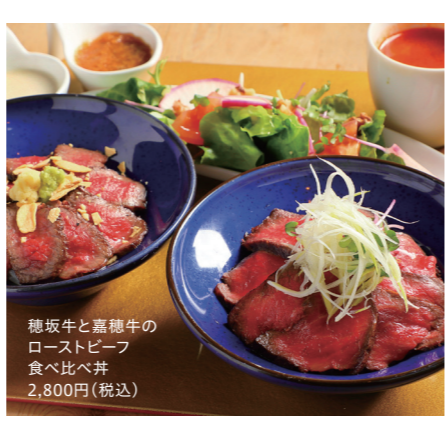
穂坂牛と嘉穂牛のローストビーフ食べ比べ丼 2,800円(税込)