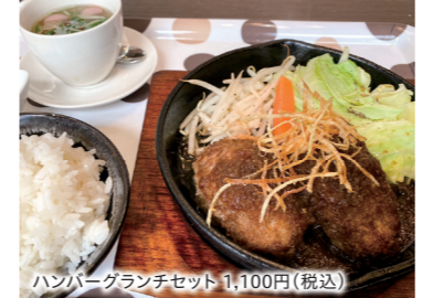
ハンバーガーランチセット 1,100円(税込)