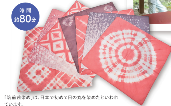
「筑前茜染め」は、日本で初めて日の丸を染めたといわれています。